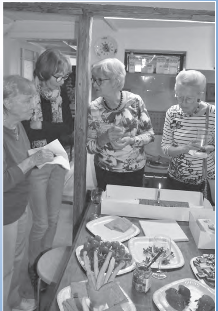
Angeregte Gespräche am Jubiläumssapéro