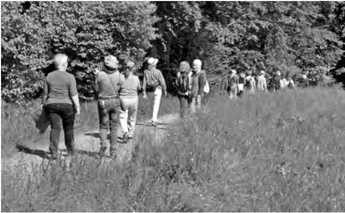
Gemeinsam unterwegs – in und um Oberrieden