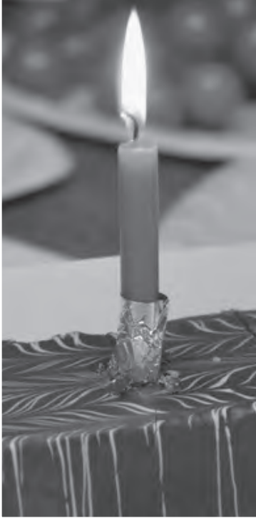
1 Jahr ZÄMEGOLAUFE Oberrieden