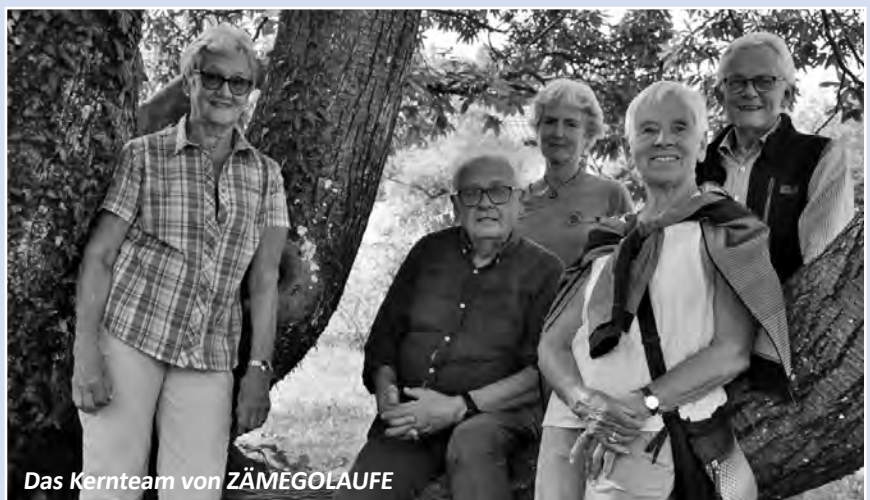
Das Kernteam von ZÄMEGOLAUFE