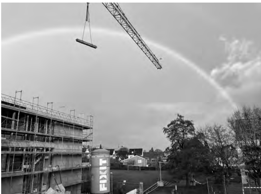
Schulhaus Pünt mit neuer Etappe

Das «Honorarangebot» musste bis im Juni 2021 der Firma Landis AG, Bauingenieure und Planer, welche mit der Beurteilung beauftragt worden war, abgegeben werden.