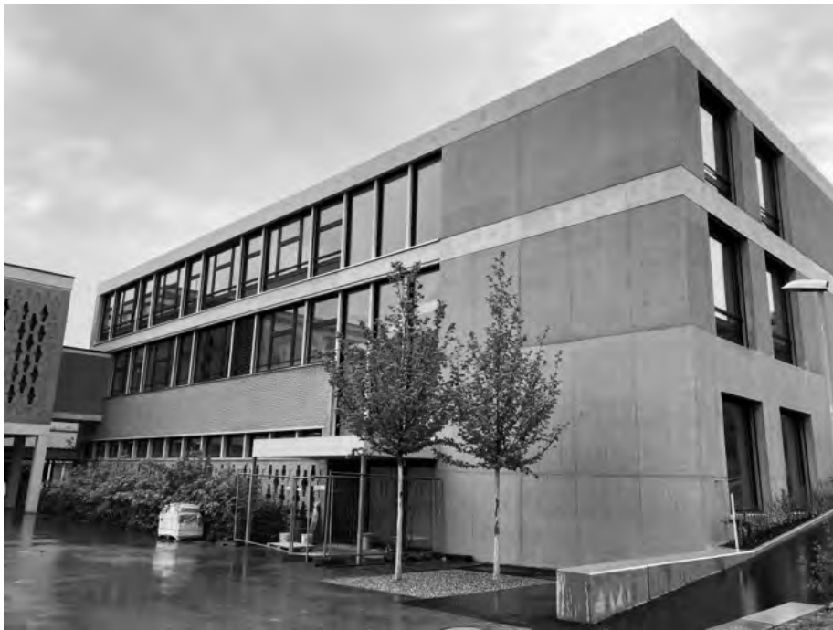
Baustelle Schulhaus Pünt

Aufgrund dieser kriterienbasierten Beurteilung wurde schliesslich das Büro Gutknecht Jäger Architektur GmbH mit der Realisierung des Projekts beauftragt. Es ist sehr erfreulich, dass bei der vor der Fertigstellung stehenden Schulhaus-erweiterung die finanziellen Vorgaben vollumfänglich eingehalten werden.