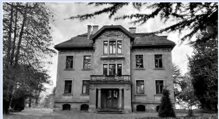
Villa Schönfels in Oberrieden – Sprachen lernen in schönem Ambiente

Anmeldung und weitere Auskünfte erwachsenenbildung@oberrieden.ch Tel. 044 722 71 08