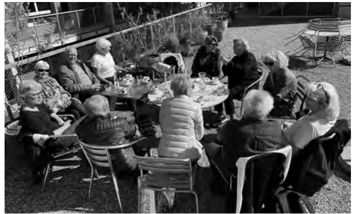
Gemütliches Kennenlernen und Austauschen am monatlichen Stammtisch