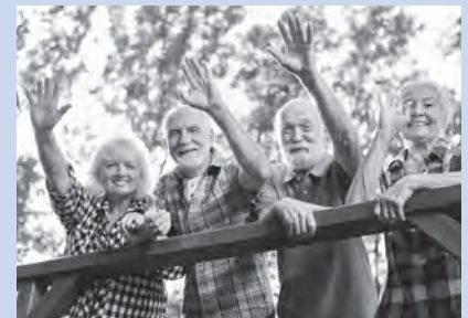
Abb. 3: Willkommen

ZÄMEGOLAUFE ist ein kostenloses Angebot von und für Oberriednerinnen und Oberriedner.