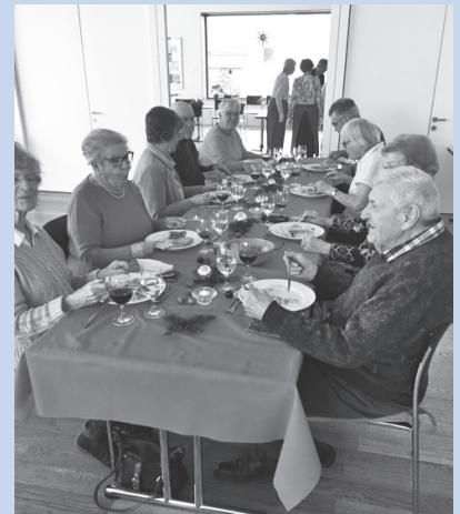
Abb. 3: Zusammen am Mittagstisch

Jeden Mittwoch von 12 bis 14 Uhr (ausser in den Schulferien) findet im Zürcherhaus der Reformierten Kirchgemeinde Oberrieden ein gemeinsames Mittagessen statt.