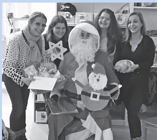
Abb. 2: Geschenkübergabe mit dem Samichlaus