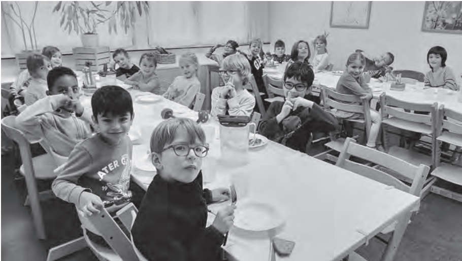
Abb. 2: Oberrieden möchte eine attraktive Gemeinde sein für Familien mit berufstätigen Eltern

Per Sommer 2023 werden zusätzliche Räumlichkeiten gesucht, die vorübergehend (zwei bis vier Jahre) für die Schulergänzende Betreuung genutzt werden können. Verfügen Sie über eine geeignete Immobilie oder kennen Sie jemanden mit einer ungenutzten Liegenschaft im Zentrum Oberriedens?